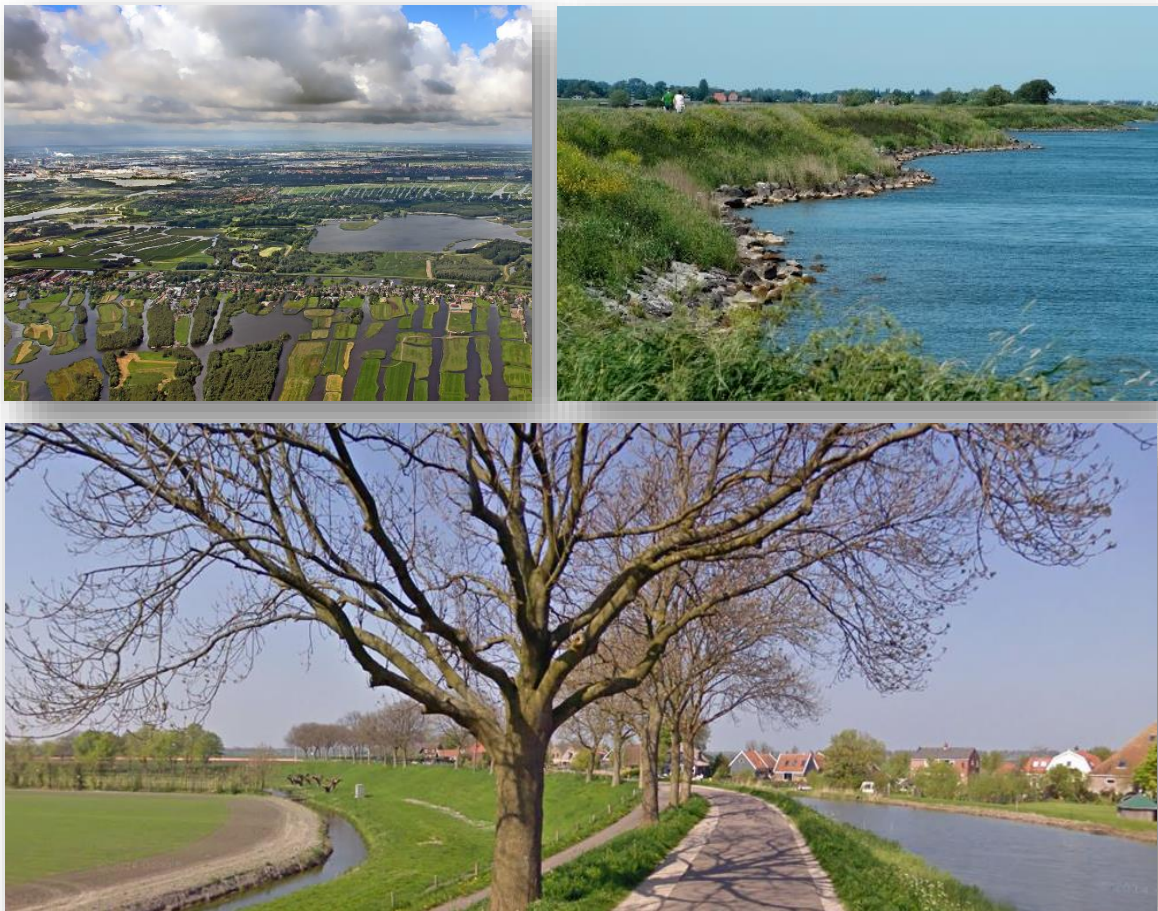
Figuur 4 Rijk aanbod aan landschapstypen

Het aanbod van het gevarieerde landschap en vergezichten, de rijke natuur en verrassende Zuiderzee stadjes,