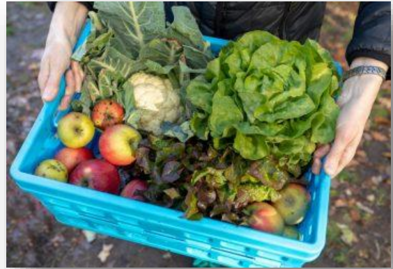
Figuur II Streekproducten

Met landbouw dichtbij wordt bedoeld dat landbouwproductie in de regio (biologisch) plaats vindt en dient als voedselvoorziening voor omliggende dorpen en steden in plaats van de wereldmarkt. Een sterk thema kan zijn dat alle (agrarische) ondernemers in het gebied een duurzaam plan hebben en starten of omschakelen naar circulair produceren en nieuwe teelten, rekening houdend met de opkomende andere waterhuishouding in het gebied. De opkomende behoefte van consumenten is dat voedsel met weinig milieudruk (transport) en dichtbij is geproduceerd. Hieraan gekoppeld zou een gedachte kunnen ontstaan van een lokale markt, waarbij de inwoners van de regio hoofdafnemer worden van het lokaal geteelde voedsel. Meer 'gevoel' en 'verantwoordelijkheid' van de consument bij de productie van ons voedsel en de (schaarse) beschikbare ruimte die we daarvoor nodig hebben.