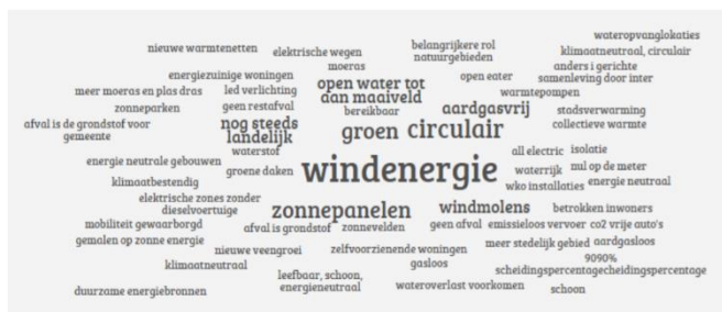
Figuur 1 Duurzaamheidsvisie van professionals Landsmeer 2050

Duurzaamheid is een breed begrip waarin een veelvoud van aanvliegroutes past. Vanuit de maatschappelijke opgave wordt hier met duurzaamheid bedoeld op de bijdrage van gebieden aan energietransitie en klimaatadaptatie (bijv. waterberging) en circulaire ontwikkeling. Binnen Nederland staan we voor grote maatschappelijke opgave op het gebied van duurzaamheid die ruimtelijk vertaald moeten worden. Voor elke potentiële locatie moet bepaald worden of deze in aanmerking komt voor het invullen van deze opgave. Twiske-Waterland kan op gebiedsniveau compensatie organiseren om tot een energie- en CO 2 -neutraal gebied te komen. Nieuwe ontwikkelingen moeten bijvoorbeeld in hun eigen energie voorzien. Of door het ontwikkelen van locaties voor zonneakkers, geothermie, energieopslag, waterberging voor piekopvang, CO 2 -reductie (laagveen, bospercelen) en duurzame landbouw. Dit vraagt letterlijk om ruimte en om selectie bij activiteiten. En het zal gestroomlijnd moeten worden met landschapsambities (openheid) en recreatie- en natuurwaarden.